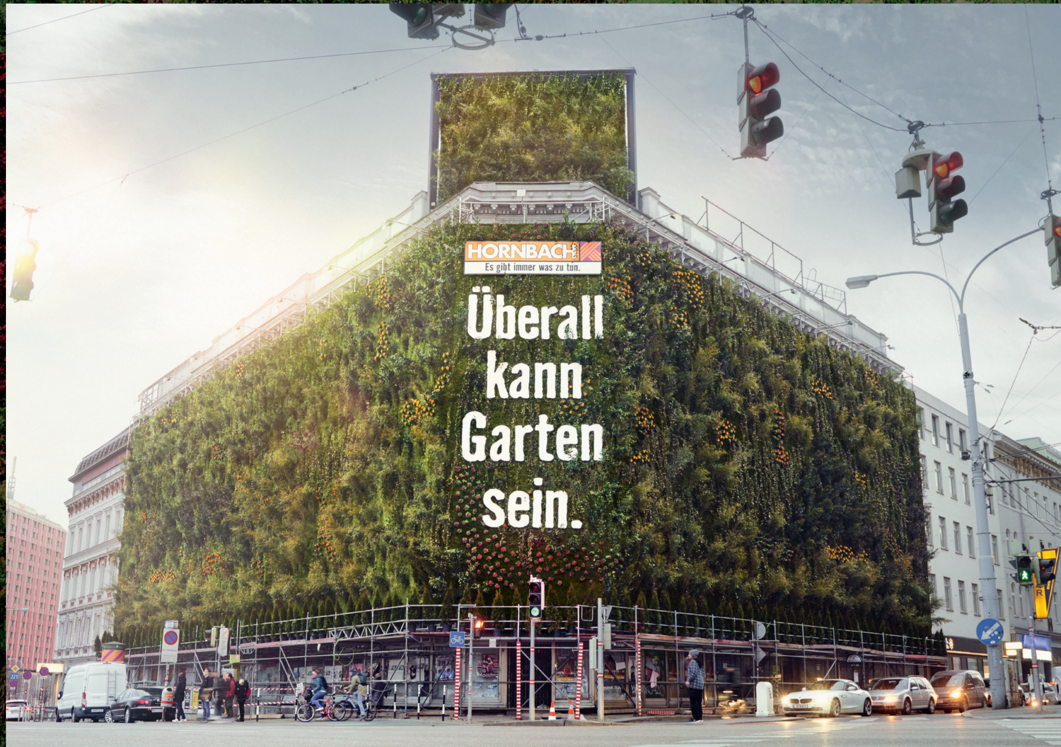
Hausfassade in Wien

Die Urbanisierung ist außer Kontrolle geraten: Städte werden immer grauer, Wohnraum immer enger, Straßen verschmutzter und flächendeckend versiegelt. Dabei müssten Städte grüner werden, um überhaupt lebenswert zu bleiben. HORNBACH nimmt die Dinge in die eigene Hand – und zeigt, dass keine Stadt für die Natur verloren ist. An einer 1250 m 2 großen Betonfassade an einem der meistbefahrenen Verkehrsknotenpunkte Wiens entsteht mit tausenden Pflanzen, Wiesen und einem komplexen Bewässerungssystem ein organisches Biotop. Eine grüne Lunge für eine ganze Stadt. Und der Beweis, dass ein Garten wirklich überall sein kann.